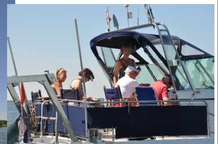
Is een zeiler alleen nog maar (zee)zot?