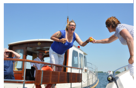
Overhandigen van de bad-eentjes