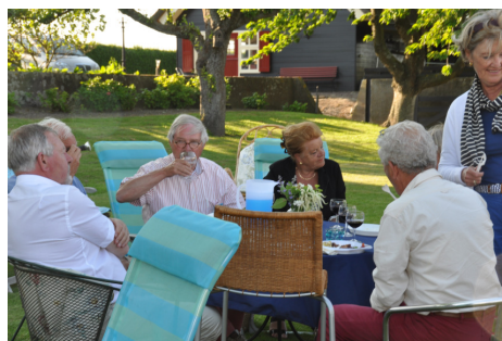
In de tuin bij de Veldhoens